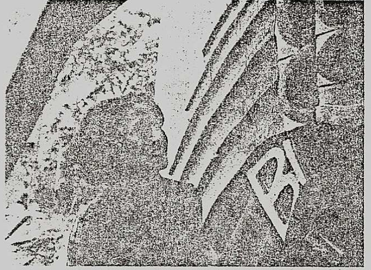
Seramik Sanatçısı TULİN AYTA (CILIZOĞLU)...

Yağmur yine çiselemeye başladı galiba?... Toprak tüm görkemiyle yağmurla bütünleşti. Toprak değişime uğradı, Orman tüm ya-